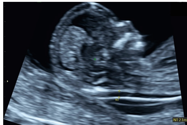
Ultraschallbild einer Nackentransparenzmessung im 1. Trimenon (12.+5 SSW)

Für das Ersttrimesterscreening muss die sog. Nackentransparenz Ihres Kindes gemessen werden. Es handelt sich hierbei um eine Flüssigkeitsansammlung im Bereich des fetalen Nackens, welche zwischen der 11+1 und 14+0 SSW darstellbar ist. Zusätzlich kann die fetale Herzfrequenz gemessen und die Darstellbarkeit des Nasenknochens in das Screening integriert werden. Darüber hinaus kann mit der frühen Feindiagnostik bereits ein Großteil schwerer Fehlbildungen frühzeitig ausgeschlossen werden.